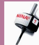
■カットワークツール