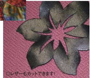
◎レザーもカットできます!