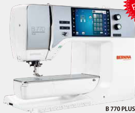
B 770 PLUS